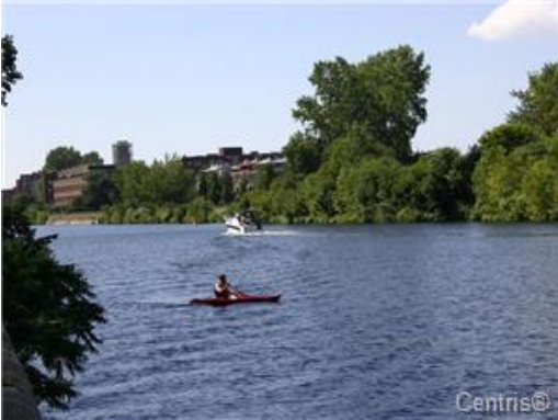
Vue sur l'eau