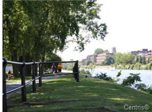
Vue sur l'eau