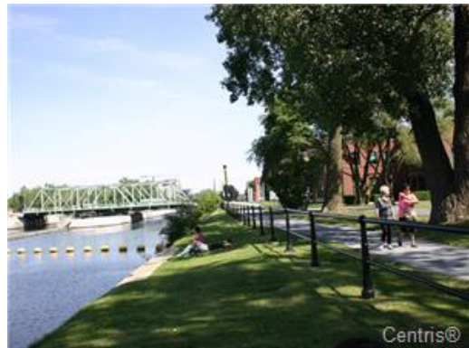
Vue sur l'eau